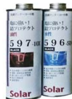
写真右：塩に強い！ 錆プロテクト 596-5D (水性) 写真右：塩に強い！ 錆プロテクト 597-10X (油性)